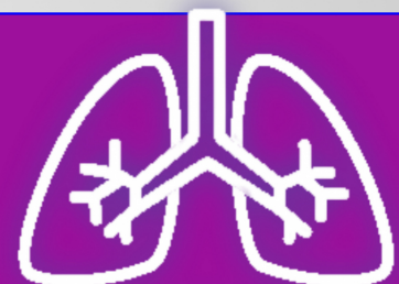
SHORTNESS OF BREATH

If you are unable to come due to sickness, please make other arrangements to pick up food and your child's materials.